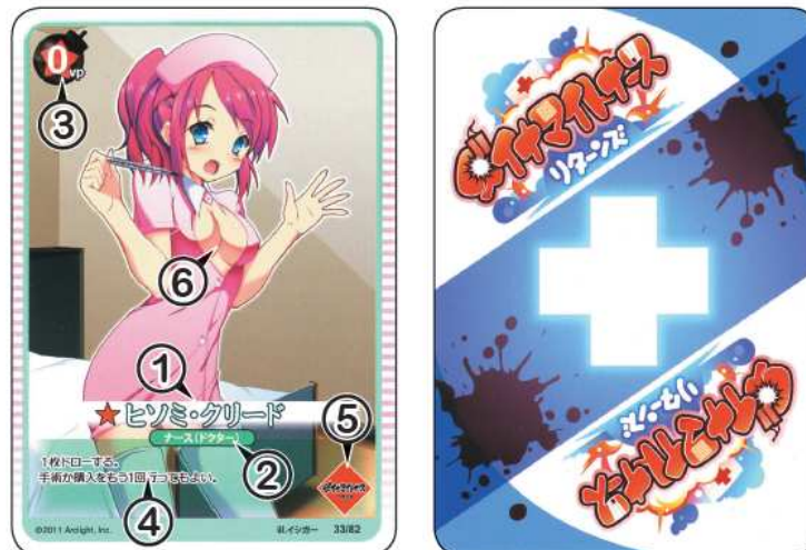
Carte infirmière: avant et arrière

Durant le jeu, les joueurs peuvent embaucher(acheter) d'autres infirmières pour améliorer leur compétences à traiter, soigner et acheter d'autres cartes